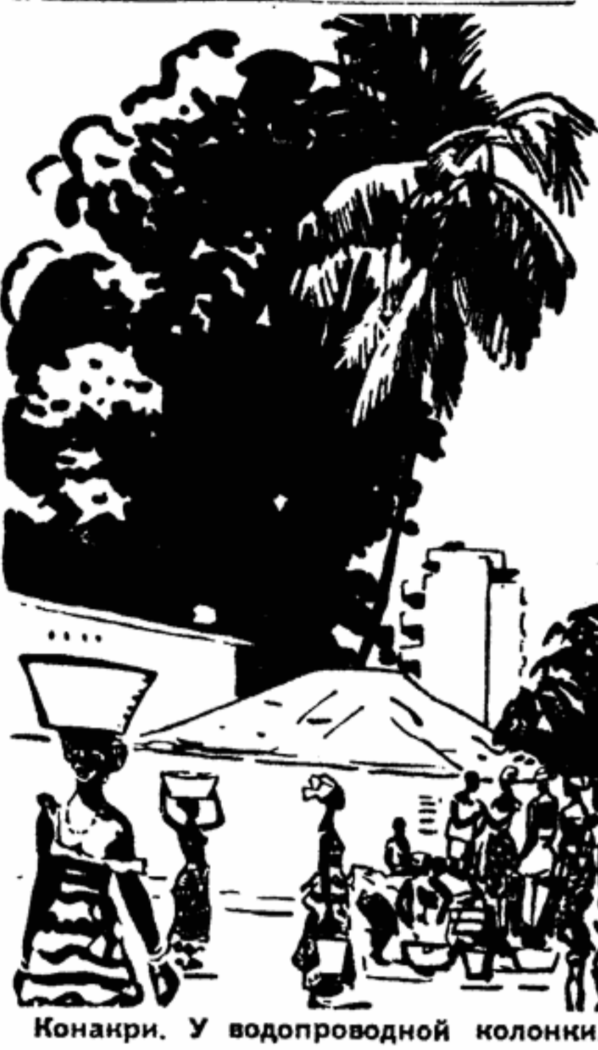
Конакри. У водопроводной колонны.

В Конакри продолжает свою работу вторая конференция солидарности народов Азии и Африки.